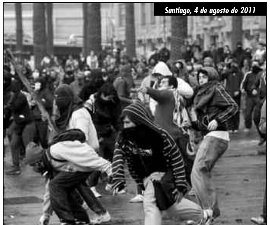
Santiago, 4 de agosto de 2011