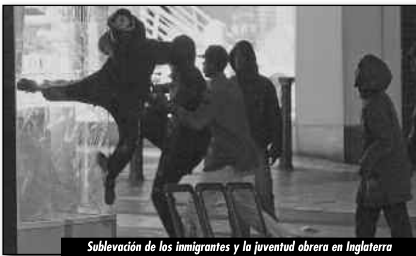
Sublevación de los inmigrantes y la juventud obrera en Inglaterra

Durante décadas estuvieron dentro del partido laborista. A su vera no son más que un apéndice del mismo, es decir, del partido de la City de Londres y de las transnacionales asesinas inglesas. Lo