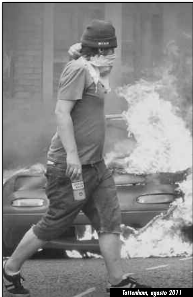
Tottenham, agosto 2011

¡Fuera de la TUC los políticos de las transnacionales y los banqueros! ¡Ellos no tienen nada que hacer en las organizaciones obreras!