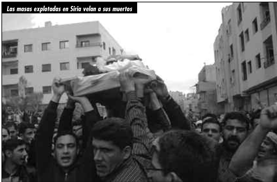
Las masas explotadas en Siria velan a sus muertos

masas explotadas sirias, empujadas por los golpes revolucionarios de todo el Norte de África y Medio Oriente, iniciaron el 15 de marzo pasado un levantamiento revolucionario por el pan y contra el régimen asesino de Bachar El Assad, sirviente absoluto del imperialismo yanqui. El 25 de abril El Assad profundiza la represión y larga los tanques del ejército a las calles.