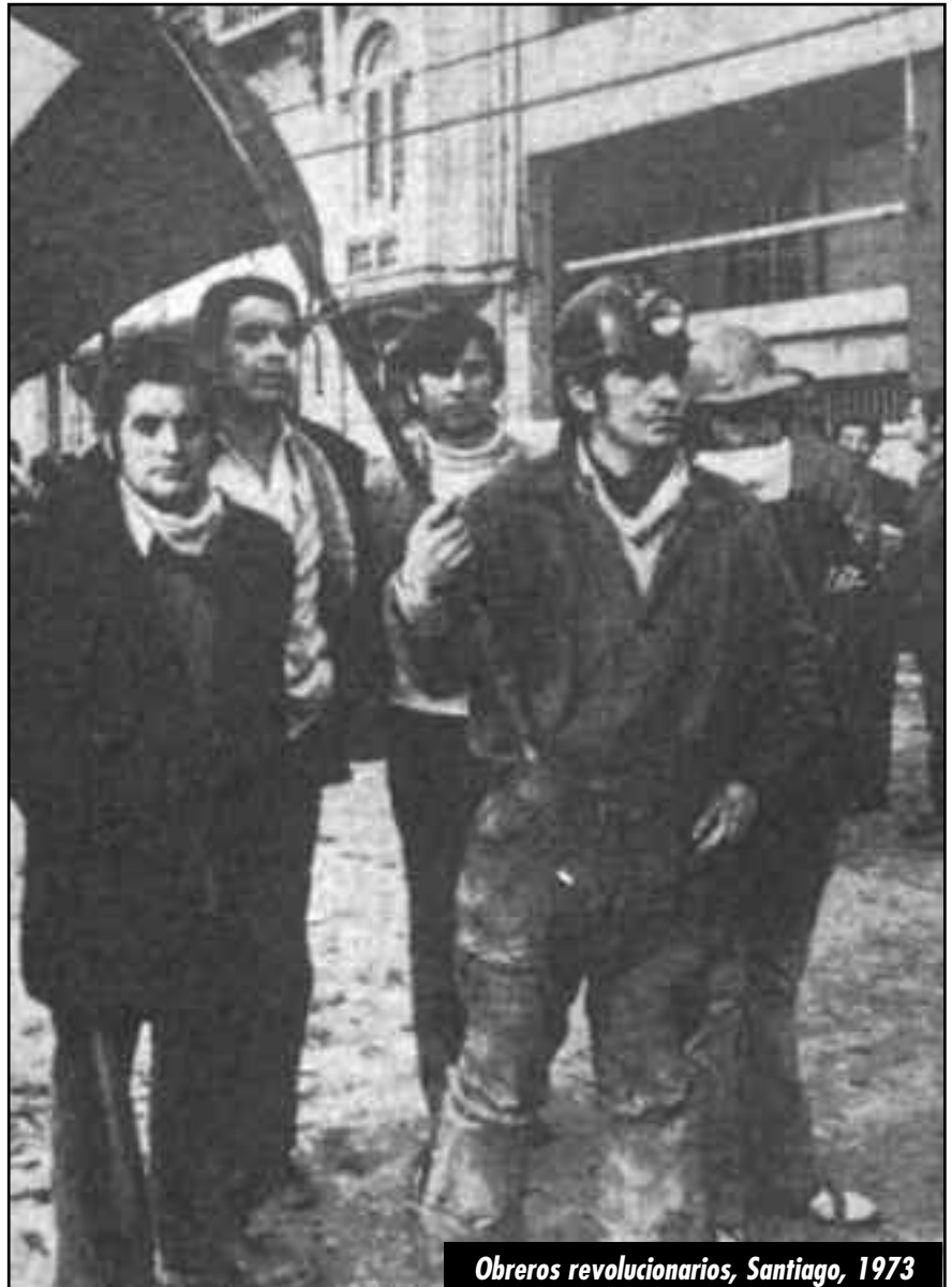
Obreros revolucionarios, Santiago, 1973

¡Abajo las direcciones colaboracionistas del movimiento obrero y estudiantil! ¡Hay que sublevar a toda la clase obrera para alzarla como caudillo de los explotados en su lucha contra el imperialismo y la burguesía lacaya, e imponer la ruptura de todas las