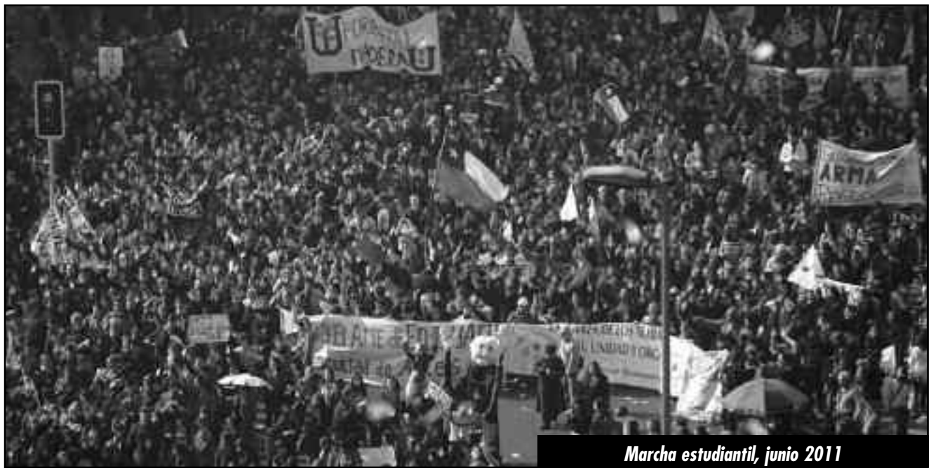
Marcha estudiantil, junio 2011

Este debe ser el grito de guerra de los trabajadores, estudiantes combativos y explotados de todo Chile que deben atar su suerte a la suerte de sus hermanos de clase latinoamericanos. En el proletariado minero de Perú y Bolivia, en la clase obrera argentina, a quien le fuera expropiada su heroica revolución por "que se vayan todos, que no quede ni uno solo", en los millones de obreros esclavos que padecen el "orden y el progreso" brasileño, están las fuerzas para librar un único combate contra los monopolios imperialistas que saquean las naciones oprimidas y superexplotan a la clase obrera a uno y otro lado de las fronteras, y contra todos sus gobiernos y regímenes cipayos. El combate revolucionario de las masas chilenas se definirá en las calles de Buenos Aires, La Paz, Lima, San Pablo, y en particular, de Nueva York y Washington. ¡Una sola lucha, una misma revolución en todo el continente americano!•