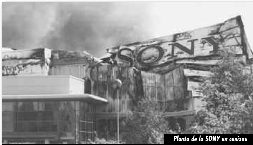
Planta de la SONY en cenizas

Los que hablaban de un “nuevo mundo” que daba lugar a la “emergencia de nuevas potencias”, no hacen y no harán más que romperse la nariz con las rocas de la crisis económica mundial. El “boom” brasilero, chino o de la India no ha sido más que un boom especulativo, financiero y de alta inversión en créditos, que alimentaron nuevas burbujas inmobiliarias, financieras, etc., a los que hoy le corresponde