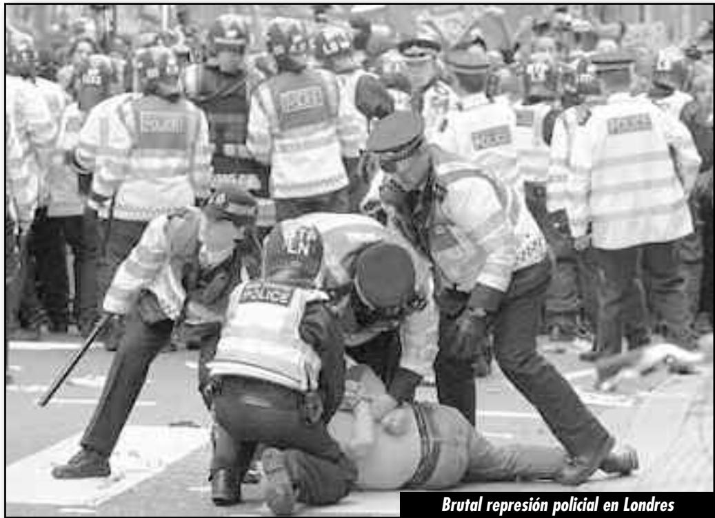
Brutal represión policial en Londres

Por eso se han callado —y no dicen ni palabra— del verdadero New Deal que es el que aplica la Merkel y el poderoso imperialismo alemán con su altísima tasa de productividad. Allí, ante el estallido de la crisis mundial, bajo el chantaje de la desocupación, se redujo un tercio del salario de la clase obrera. Mientras, el gobierno subsidia a la patronal, en base a reducir el gasto del estado, cubriéndole otro tercio del salario obrero.