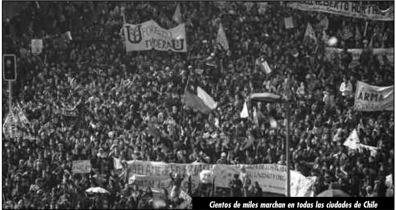
Cientos de miles marchan en todas las ciudades de Chile

(...) los estudiantes combativos y el proletariado de Chile no sólo han identificado como sus enemigos a las transnacionales que saquean el cobre, al gobierno y al maldito régimen de la Constitución del '80 redactada por Pinochet. También han identificado con clari-