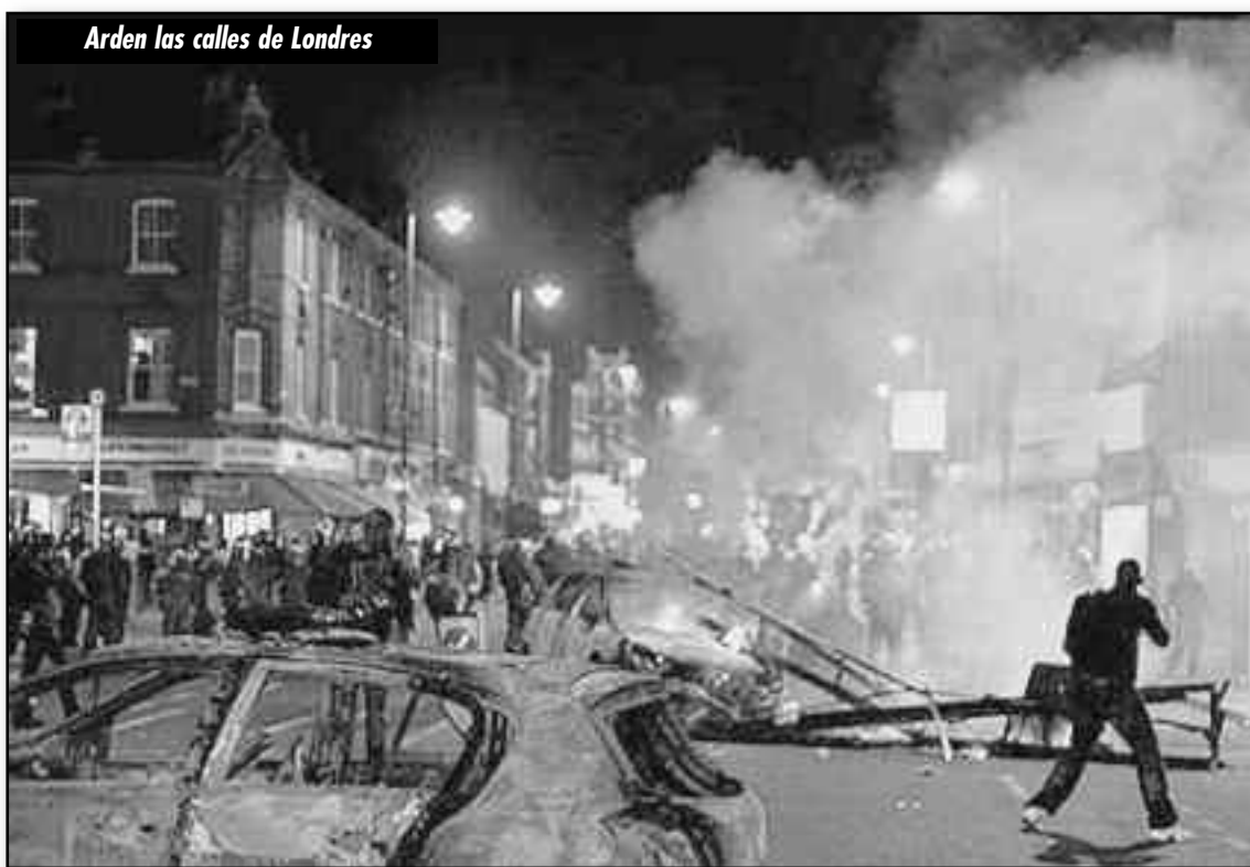
Arden las calles de Londres

La izquierda mundial seguirá hablando de "la decadencia norteamericana" en momentos en que esta potencia imperialista le tira más y más la crisis al mundo. Quieren hacerle creer al planeta que el "democrático" Obama es el presidente de un imperialismo en decadencia y