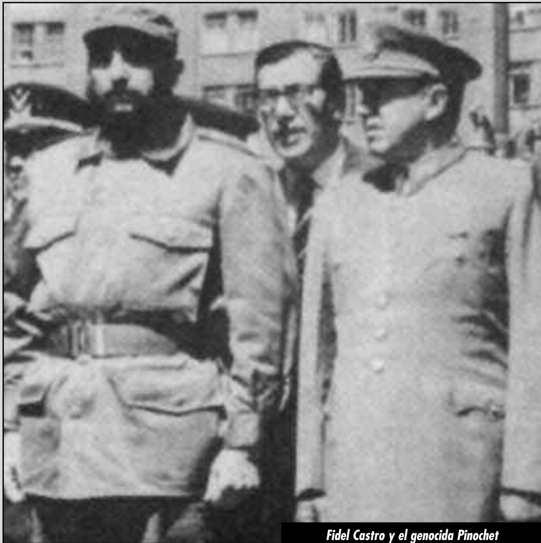
Fidel Castro y el genocida Pinochet

Hoy todas las corrientes que hablan de "Asamblea Constituyente" y "plebiscitos" quieren hacer creer que ese régimen, impuesto mediante una masacre y un genocidio fascista, puede dar algo "pacífico y democráticamente" a las masas, cuando incluso el alcalde de Santiago, Pablo Zalaquett de la UDI, ha llamado a intervenir a las Fuerzas Armadas para el próximo 11 de septiembre en caso de que no sea suficiente con la represión de los pacos asesinos. ¡Este es el verdadero régimen cívico-militar: el de los generales asesinos de la dictadura, de la entrega de la nación al imperialismo, de la Constitución pinochetista del '80! Estas corrientes terminan planteando que se