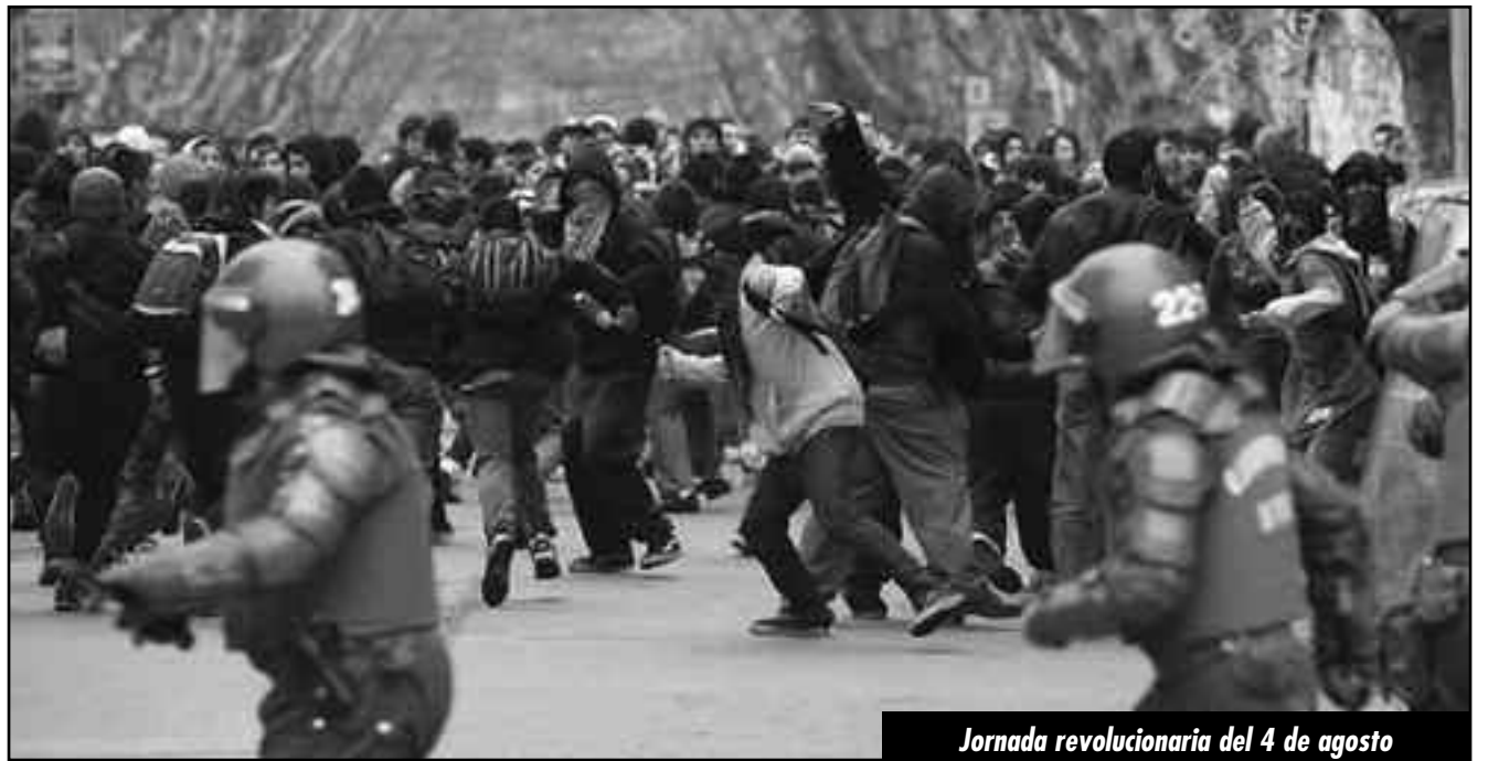
Jornada revolucionaria del 4 de agosto

¡Abajo la ley de amnistía de 1978! ¡Tribunales obreros y populares para juzgar y castigar a los milicos y políticos patronales