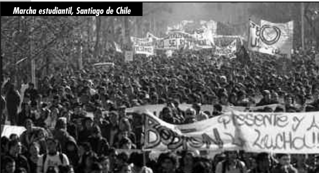
Marcha estudiantil, Santiago de Chile

Contrario a lo que plantean amplios sectores de la izquierda reformista, sobre que en el actual levantamiento no ha estado presente el movimiento obrero, la realidad dice todo lo contrario. Pese a la desincronización y aislamiento que